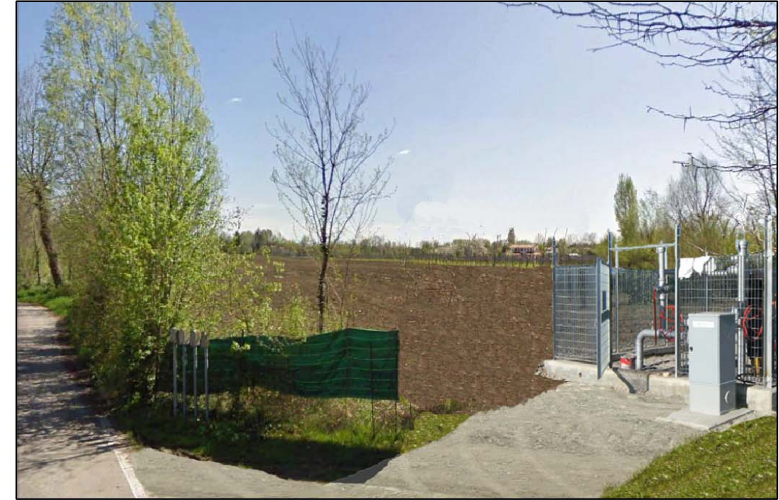
VISTA 2: STATO DI PROGETTO