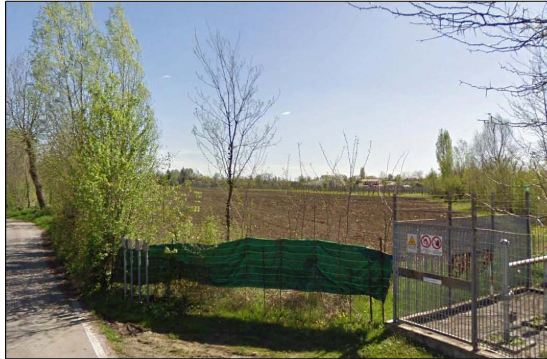
VISTA 1: STATO DI FATTO