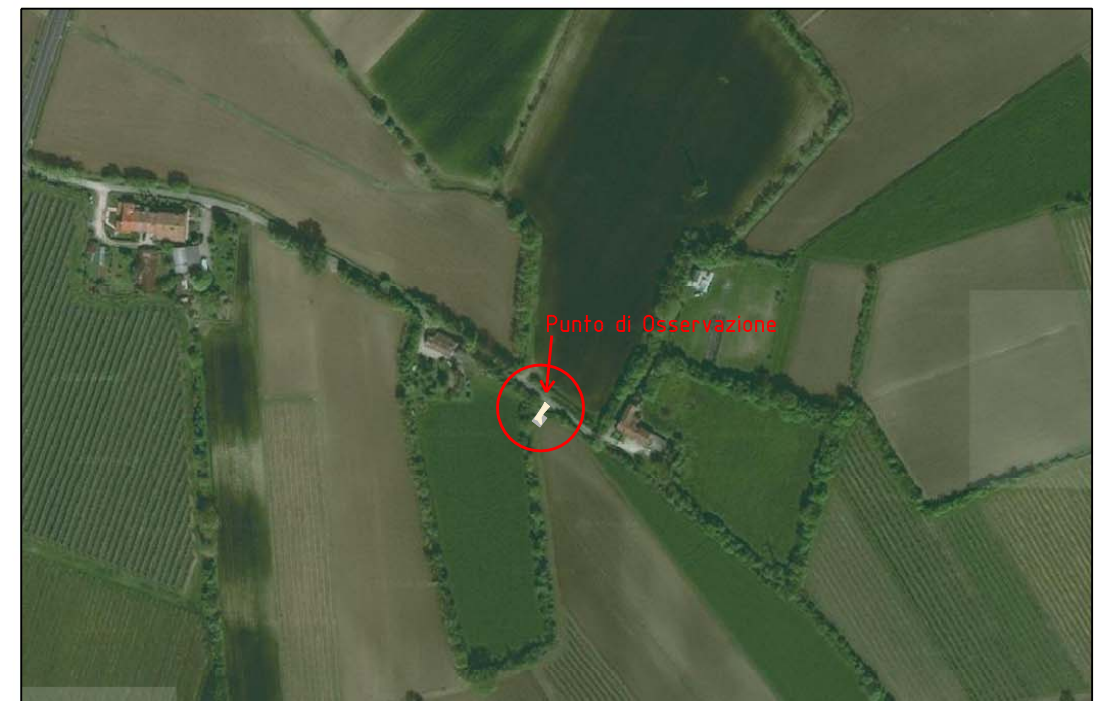
VISTA 4: FOTO AEREA CON EVIDENZIATA L'AREA DI INTERVENTO