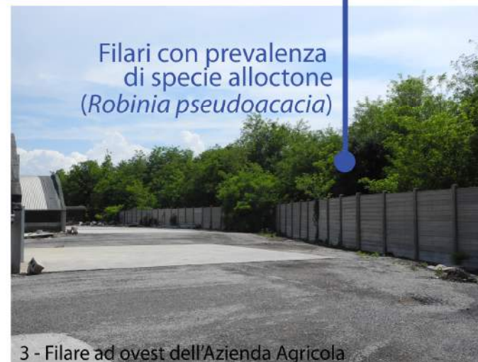
Filari con prevalenza di specie alloctone ( Robinia pseudoacacia )