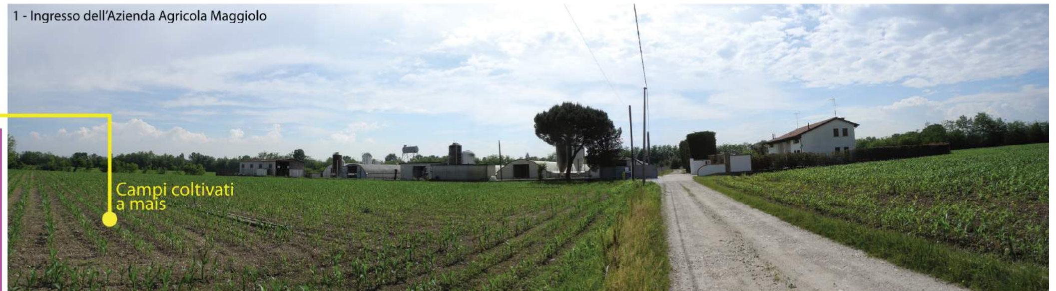
Campi coltivati a mais