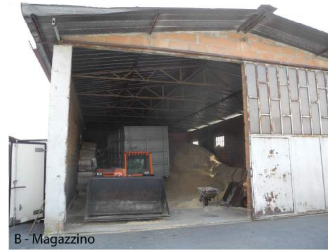
B - Magazzino