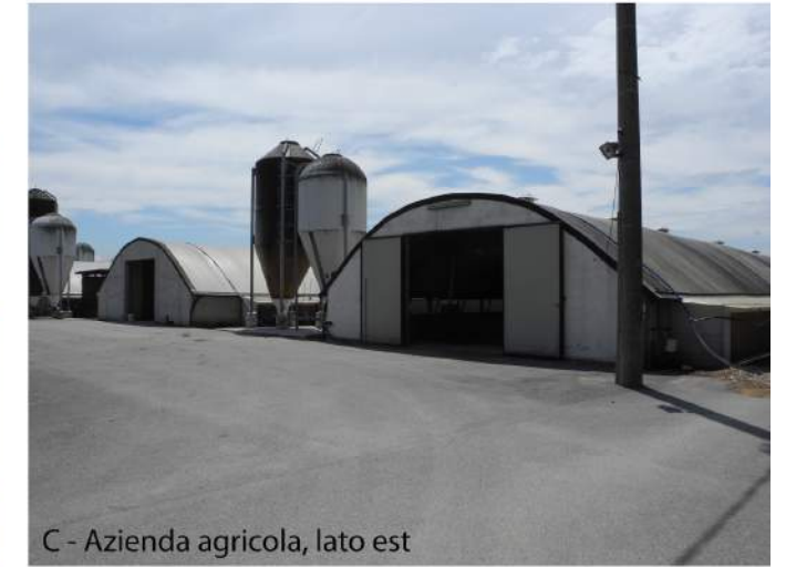
C - Azienda agricola, lato est