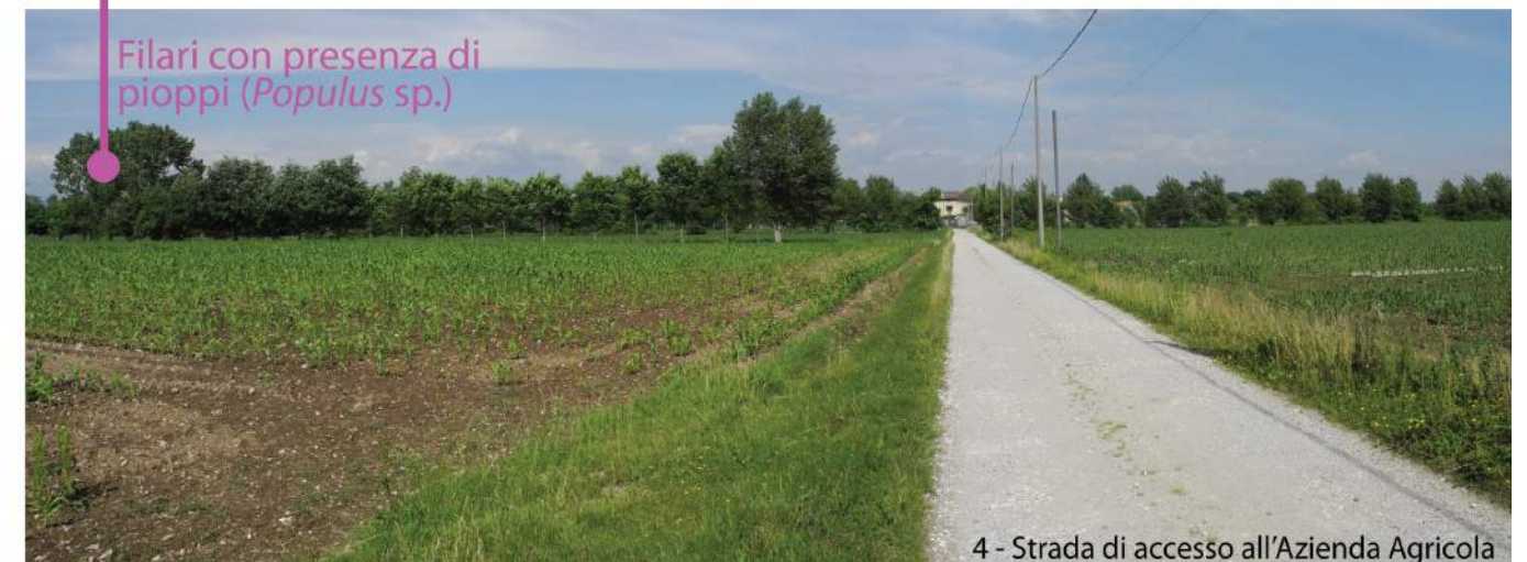
Filari con presenza di pioppi ( Populus sp. )