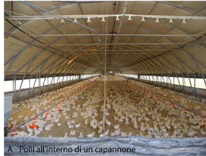
A - Polli all'interno di un capannone