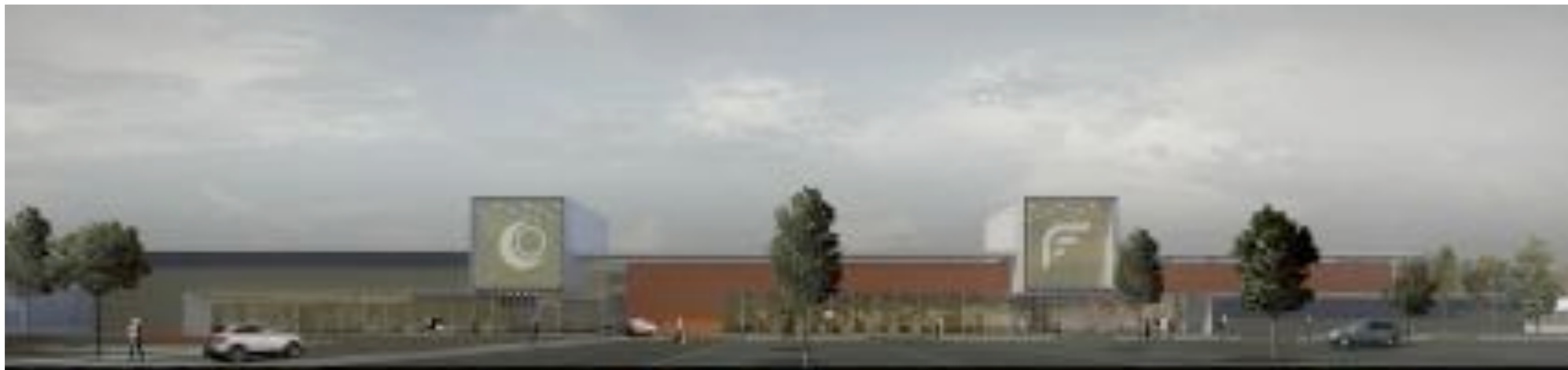
VISTA RENDERIZZATA PROSPETTO SUD