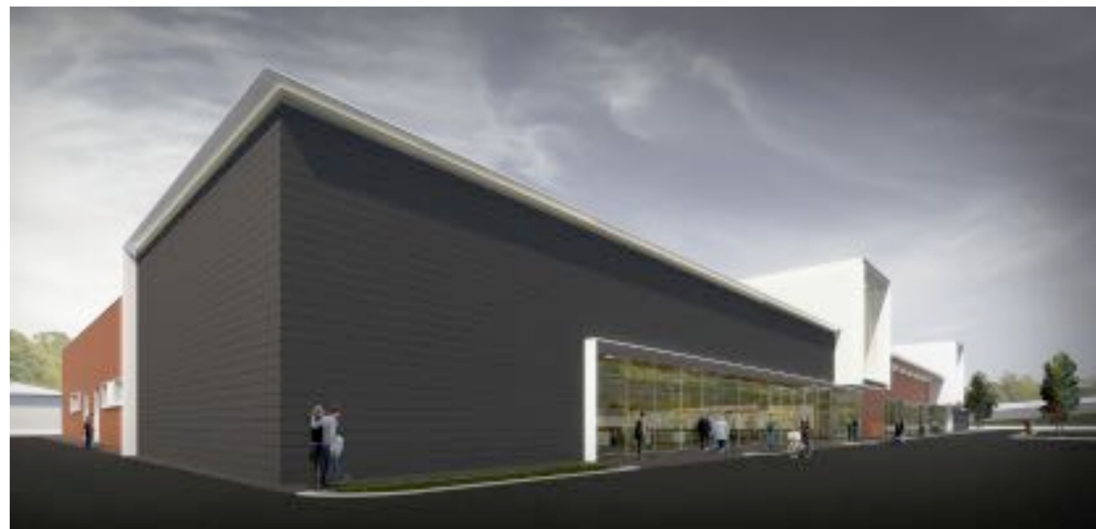
VISTA RENDERIZZATA PROSPETTO SUD OVEST