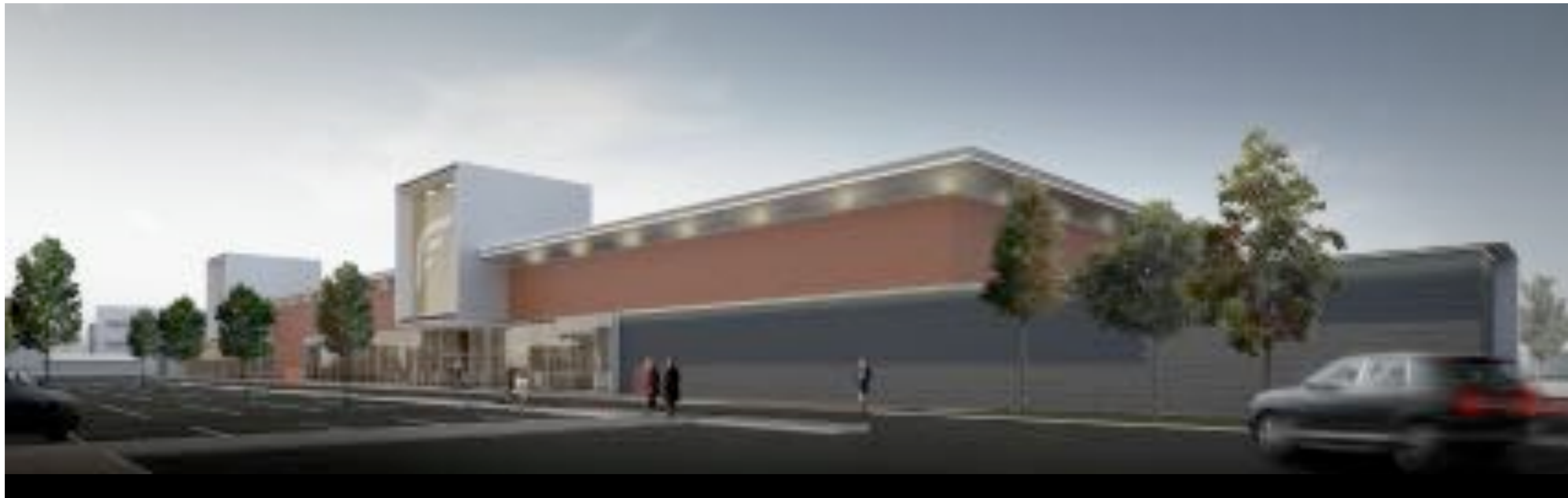
VISTA RENDERIZZATA SUD EST

s t u d i o signorotto a r c h i t e t t u r a Giorgio Signorotto - via Piccati, 7 - 31100 Treviso Italy tel. +39 0422 985801 - fax. +39 0422 991253 - info@studio-signorotto.com