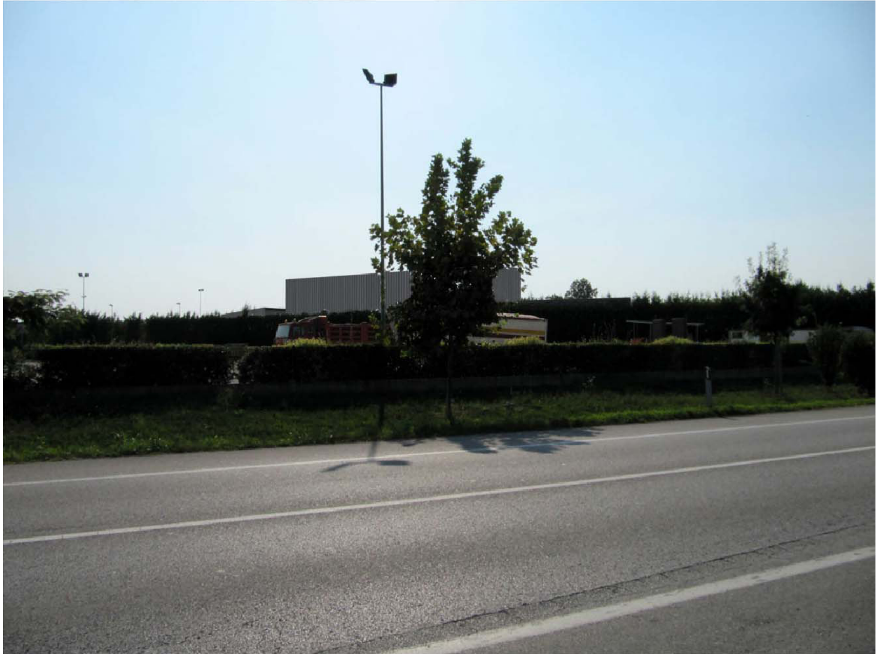
Vista rendering n.3