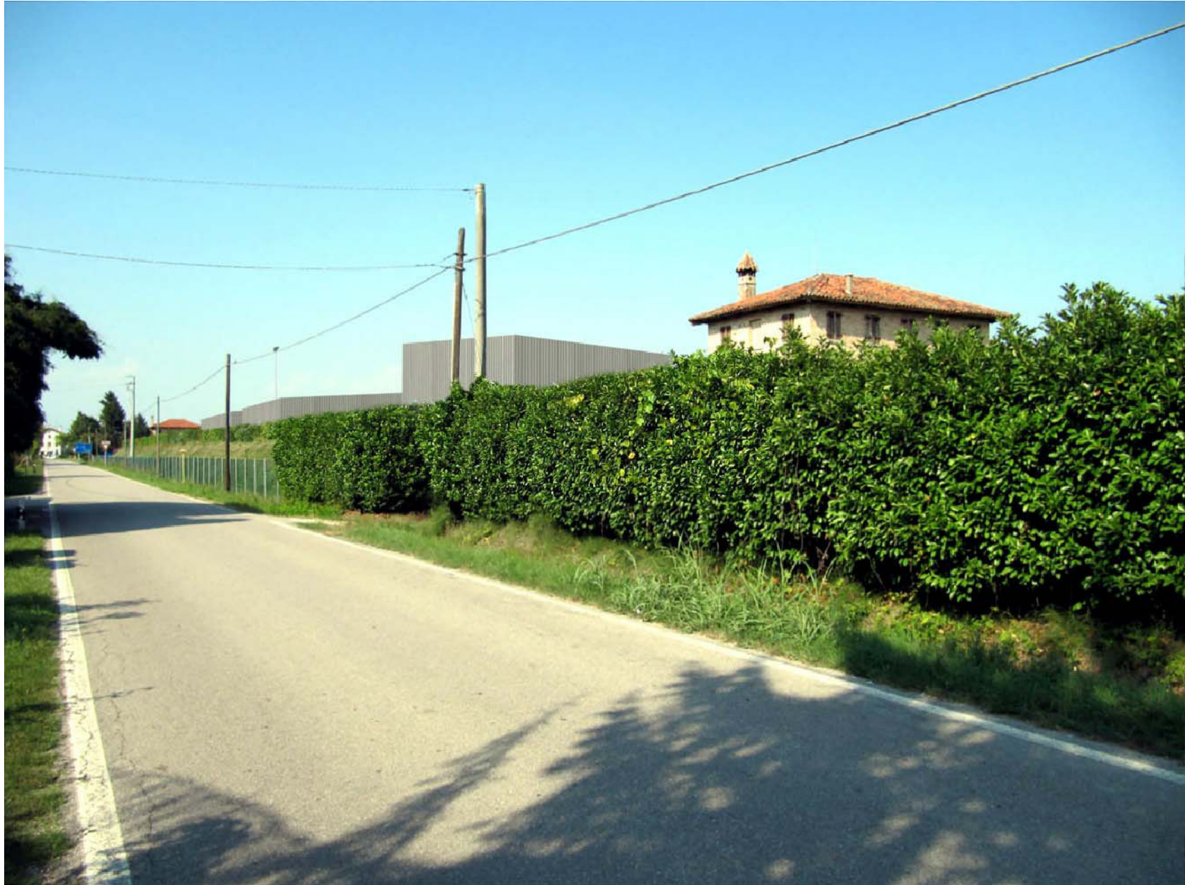
Vista rendering n.2