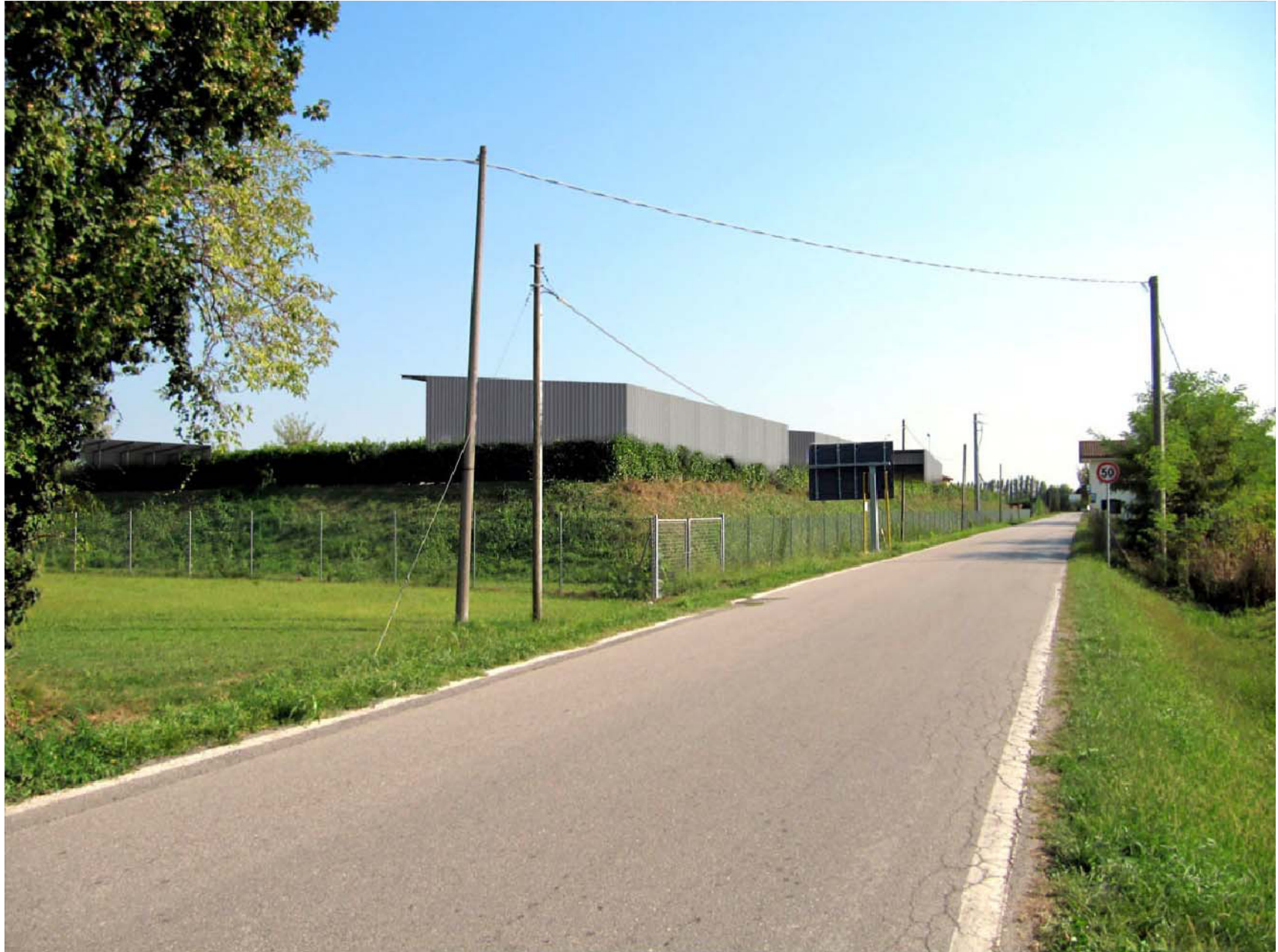
Vista rendering n.1