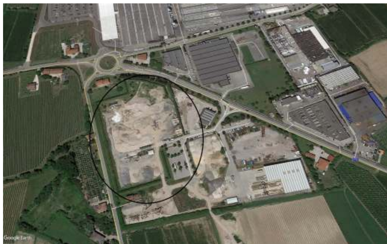
Figura 1: foto aerea

L'impianto si colloca in fregio alla zona industriale di Salgareda