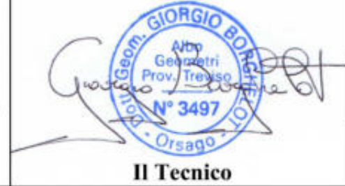
Tavola n. 06

ECO SAND RECUPERI SRL Via Camparnei, 21/A 31010 ORSAGO (TV) C.F./P.IVA n° R.I. 03163490265