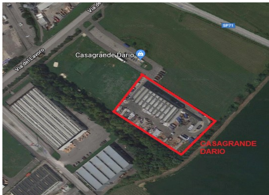
Immagine n. 1