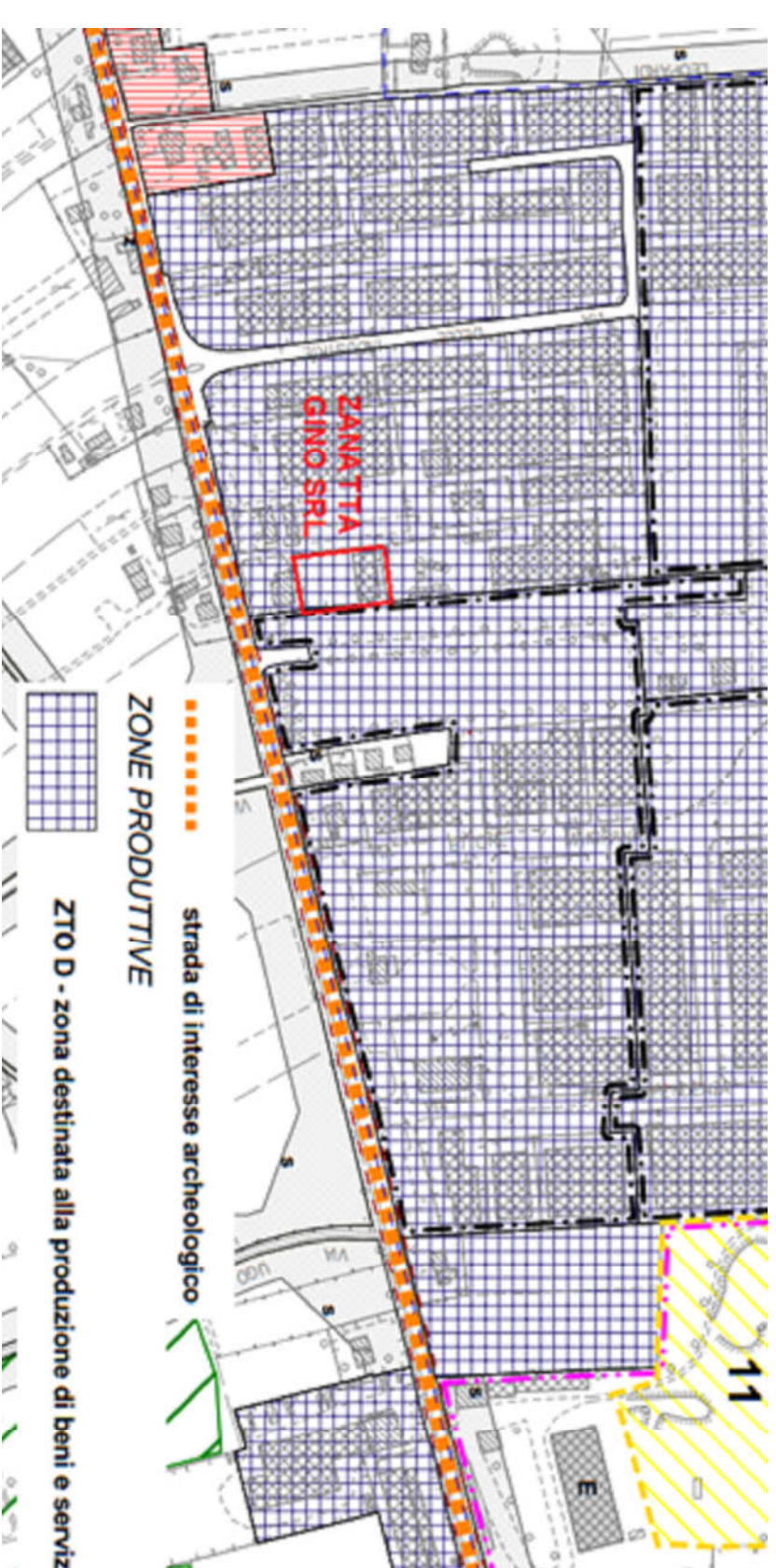
ESTRATTO del PIANO DEGLI INTERVENTI