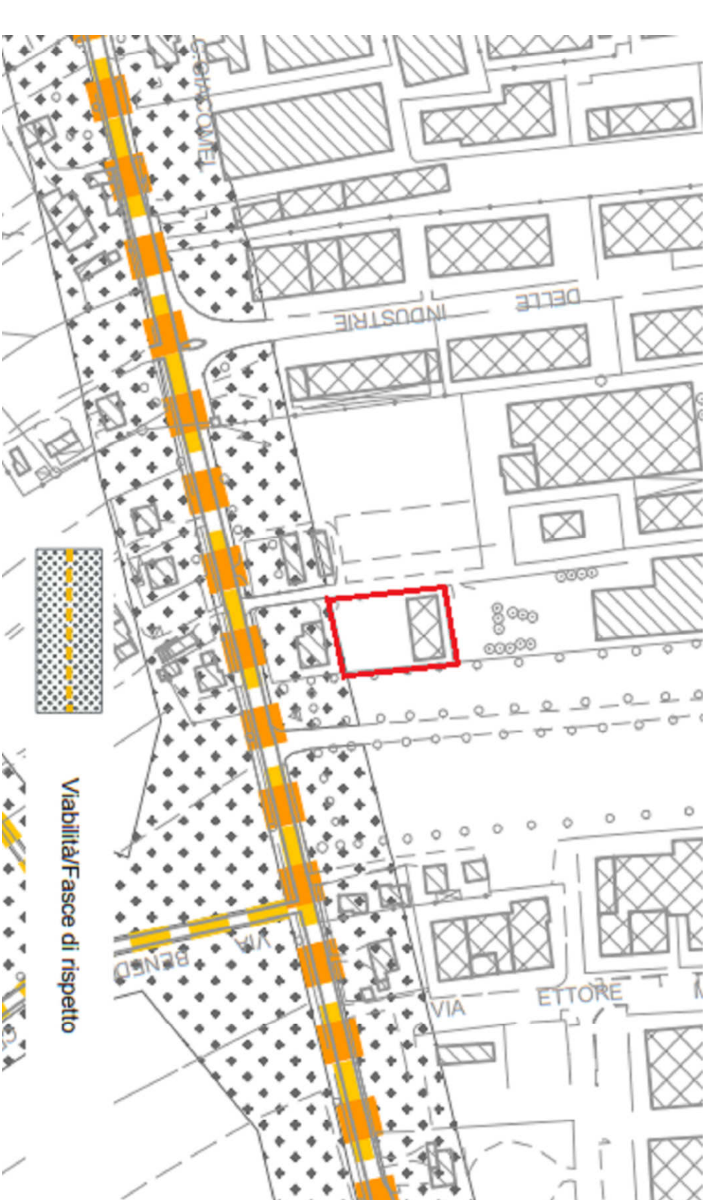
ESTRATTO TAV. 01 - VINCOLI E PIANIFICAZIONE TERRITORIALE P.A.T.