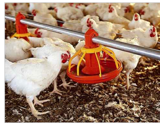
foto tipo abbeveratore a goccia