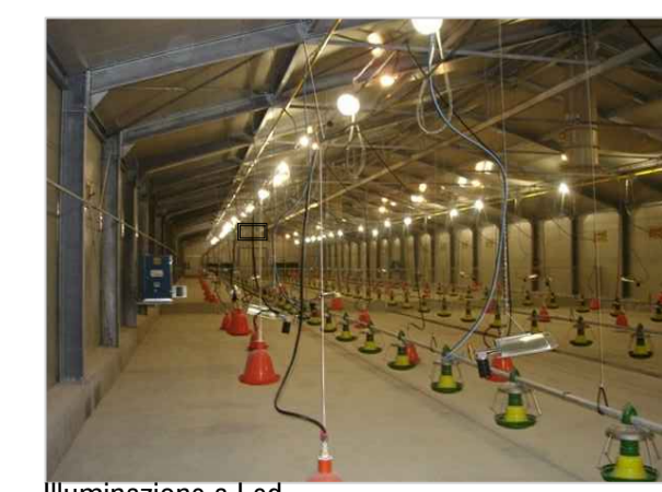
Illuminazione a Led