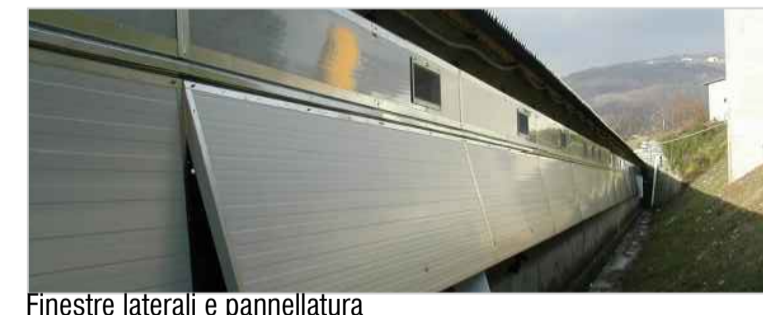
Finestre laterali e pannellatura