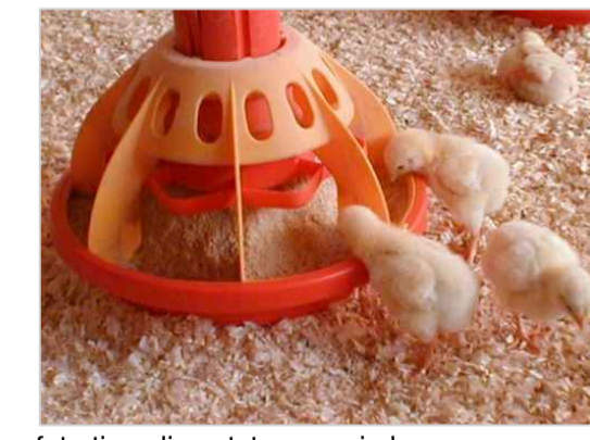
foto tipo alimentatore a spirale