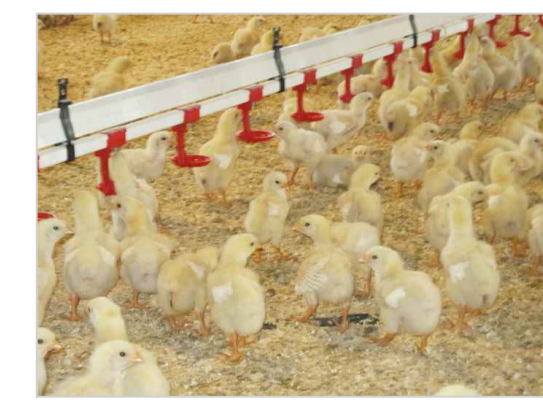
foto tipo abbeveratore a goccia