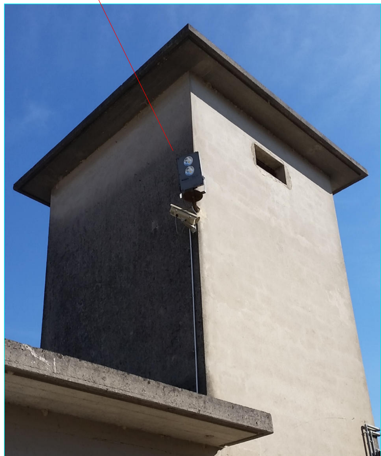
CONO VISIVO "C"