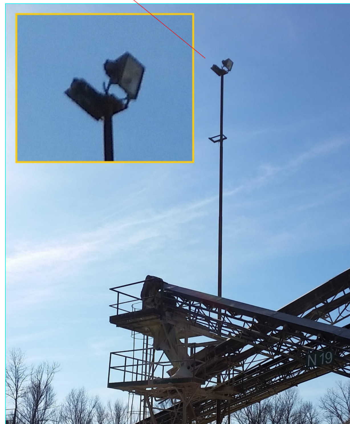
CONO VISIVO "E"