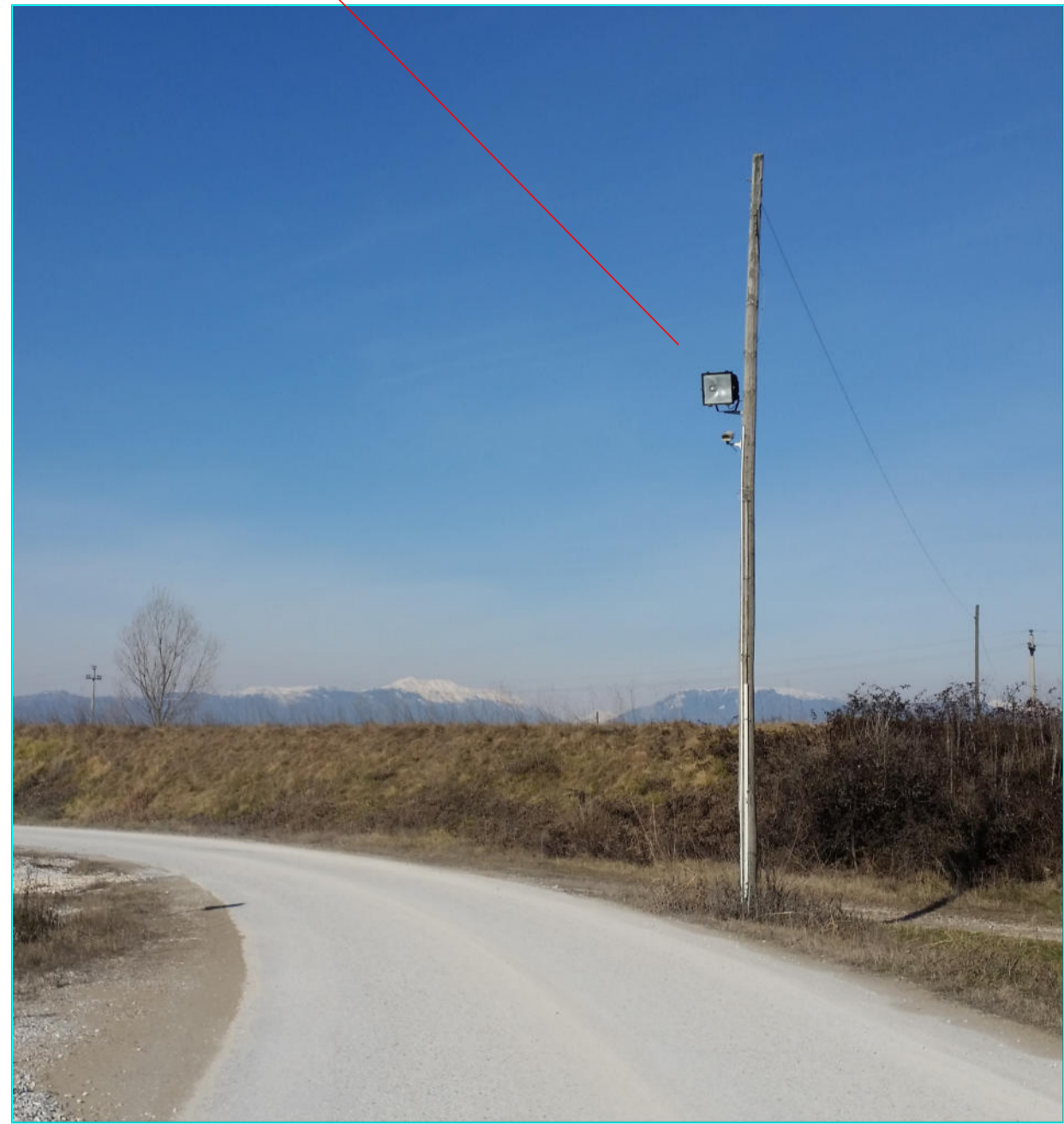
CONO VISIVO "A"