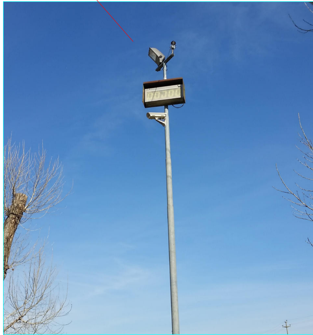
CONO VISIVO "B"