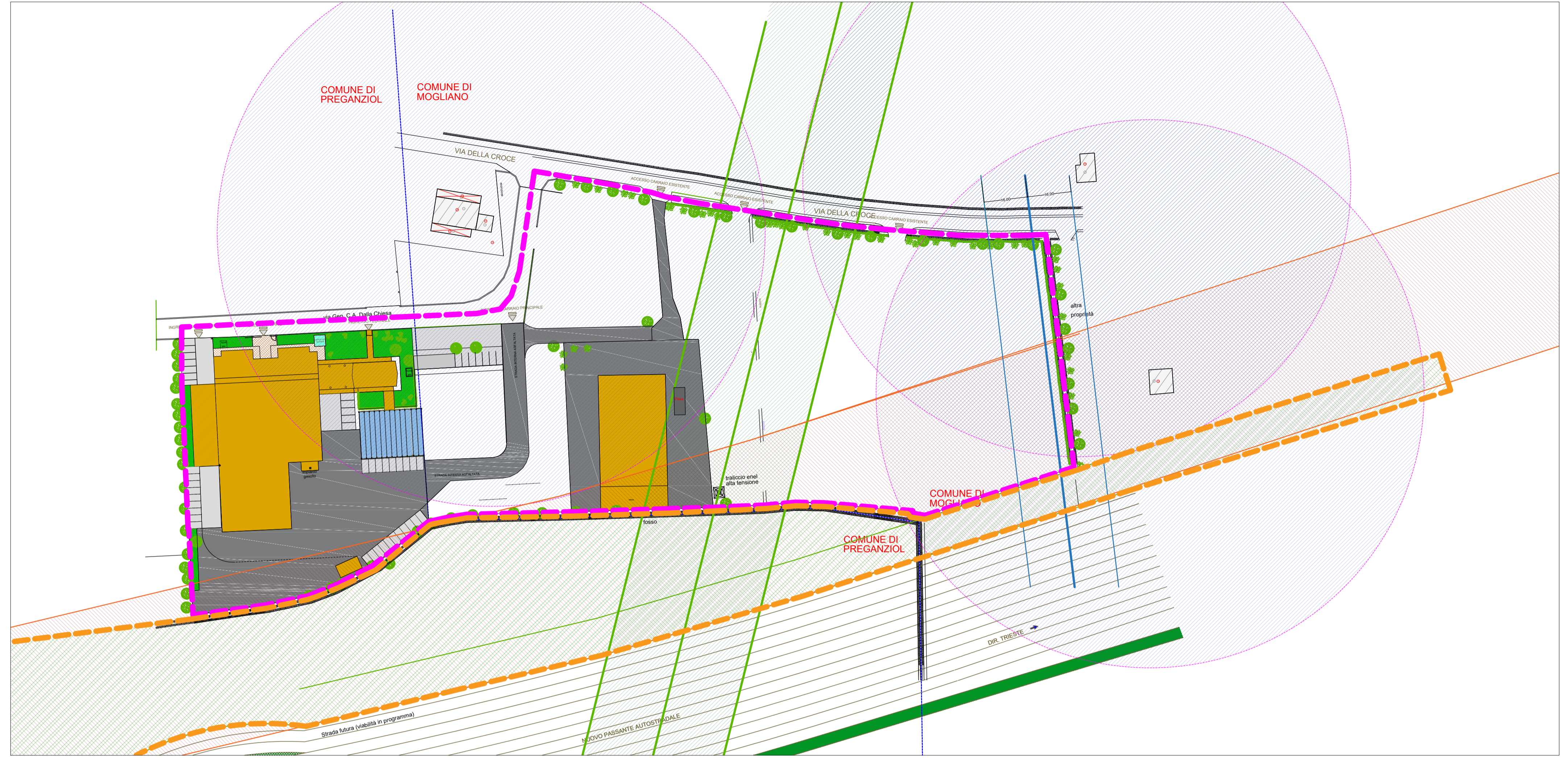
STATO DI FATTO SC. 1:1000

STATO DI FATTO e DI PROGETTO SC. 1:500 CON INDICAZIONE DI FABBRICATI ESISTENTI LIMITROFI E FASCIE DI RISPETTO