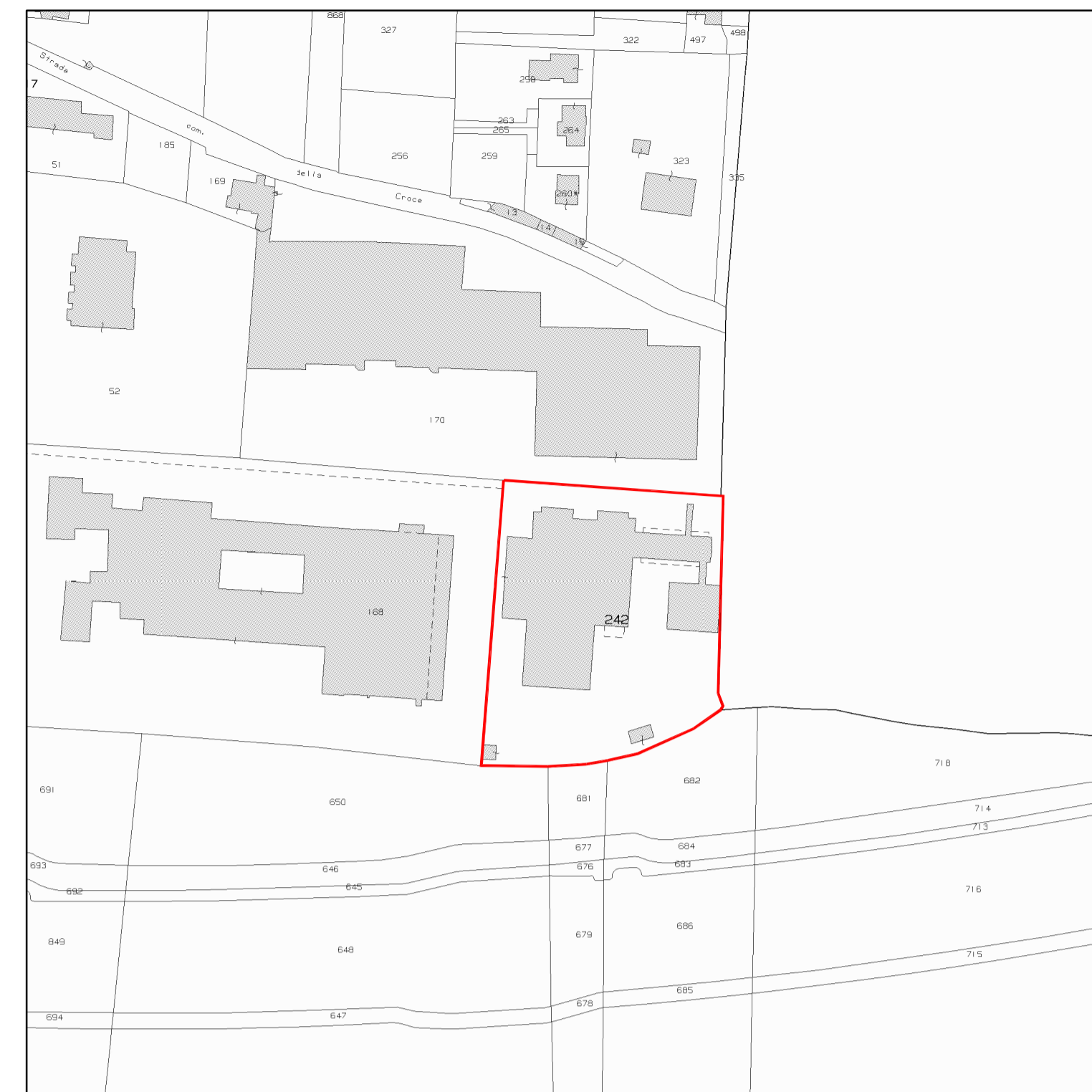
ESTRATTO MAPPA - Scala 1:2000 Preganziol (TV) - Fig. 22 Mappale 242