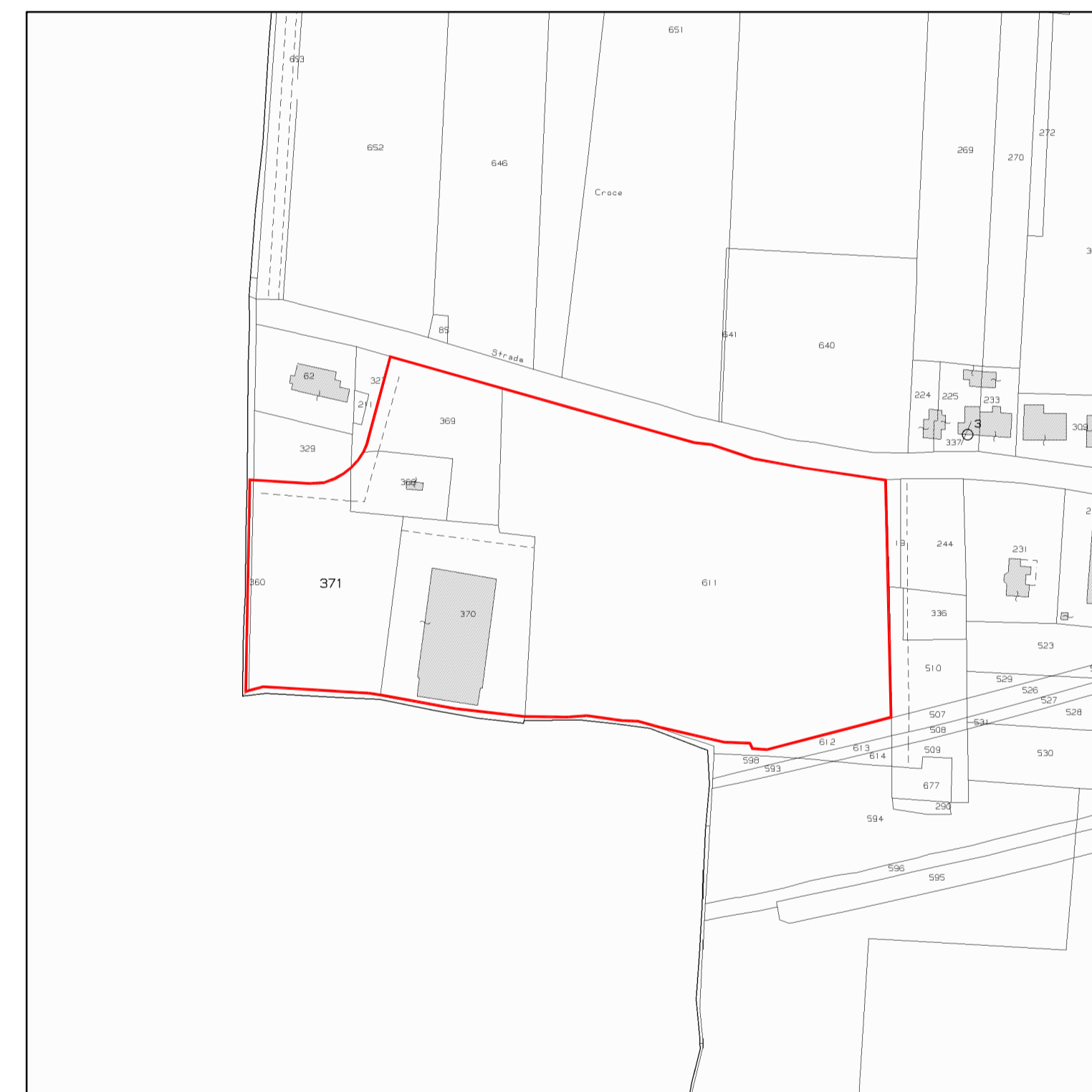
ESTRATTO MAPPA - Scala 1:2000 Mogliano Veneto (TV) - Fig. 11 Mappali 360-368-369-370-371-611