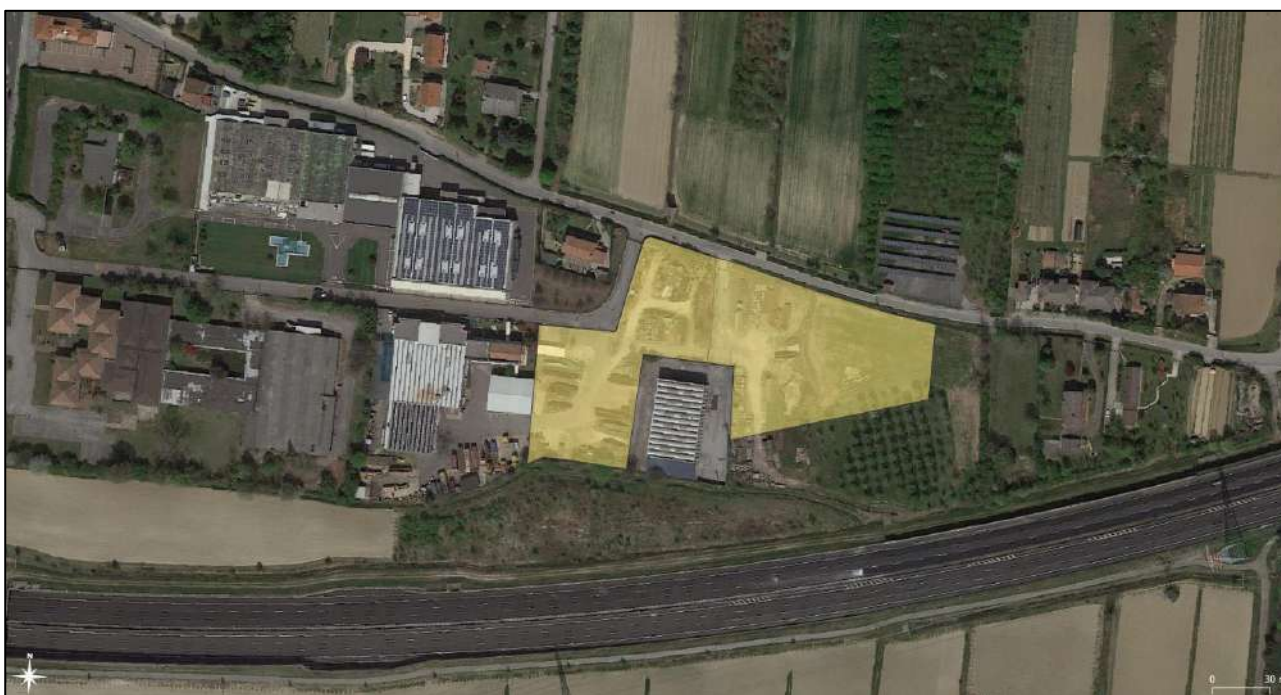
Figura 1: In giallo viene indicata l'area di espansione oggetto di modifica sostanziale

Il piano di ripristino ambientale dell'area sintetizza le attività da attuare alla chiusura dell'impianto ed è riferito agli obiettivi di recupero e sistemazione dell'area in relazione all'attuale destinazione d'uso prevista dai vigenti strumenti urbanistici (area agricola).