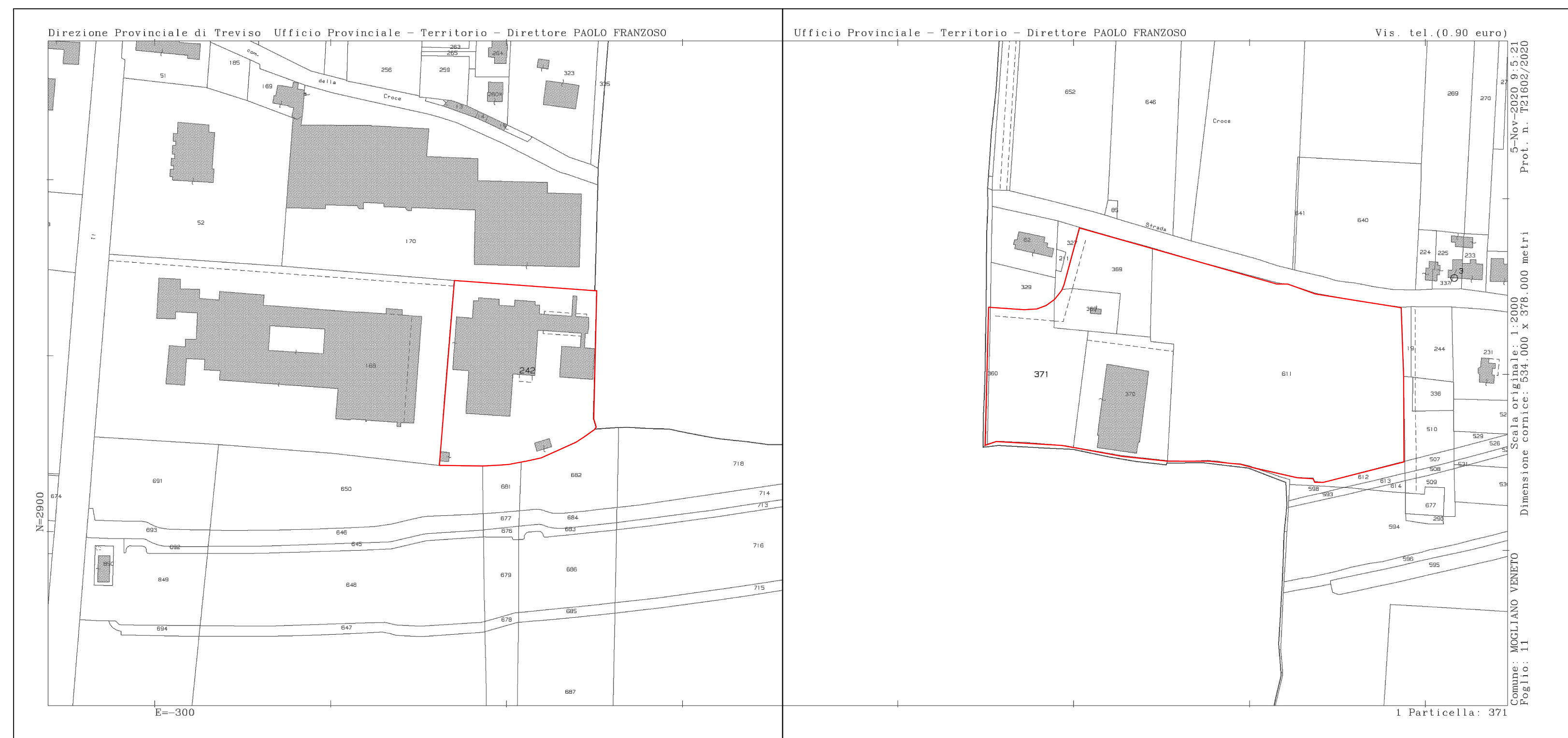
PREGANZIOL(TV) FG. 22 PART. 242