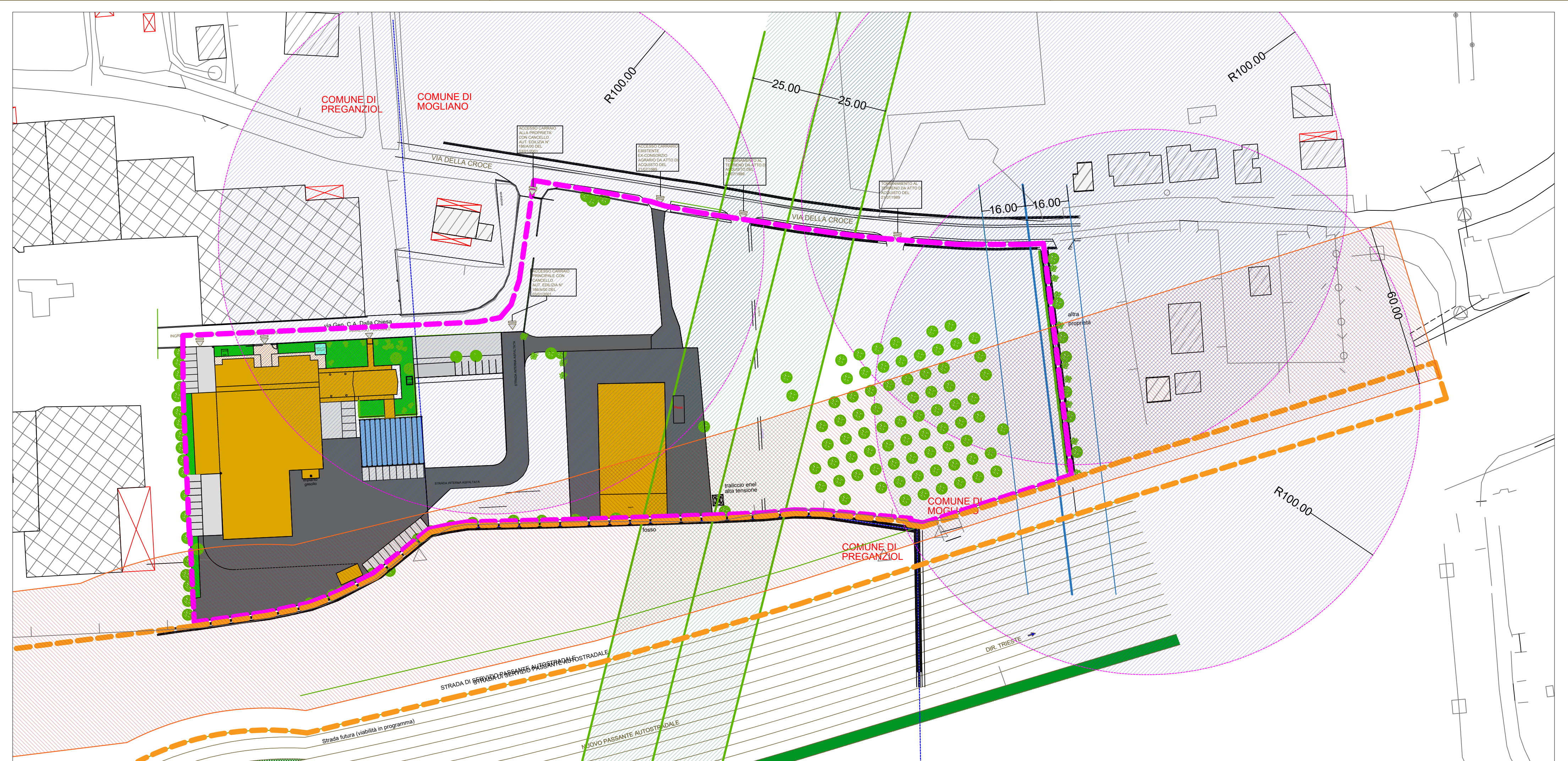
STATO DI FATTO SC. 1:1000

STATO DI FATTO e DI PROGETTO SC. 1:500 CON INDICAZIONE DI FABBRICATI ESISTENTI LIMITROFI E FASCIE DI RISPETTO