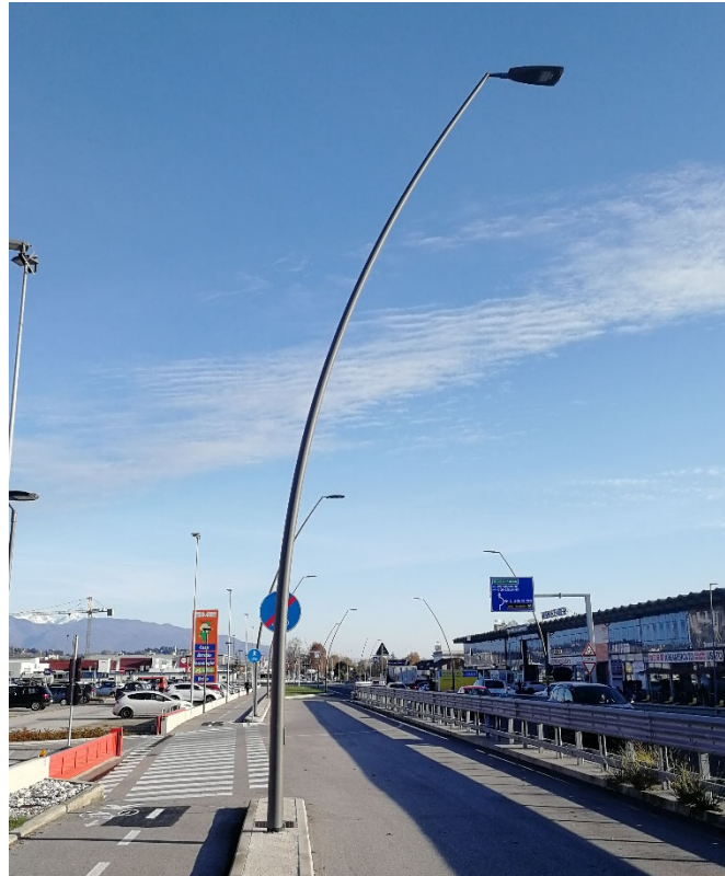
Figura 3: Illuminazione esistente lungo la S.S. 13

L'illuminazione dell'ambito A sarà da realizzarsi in analogia con quella già realizzata lungo la S.S. 13 come meglio specificato negli elaborati grafici e come da foto esemplificativa (Figura 3).