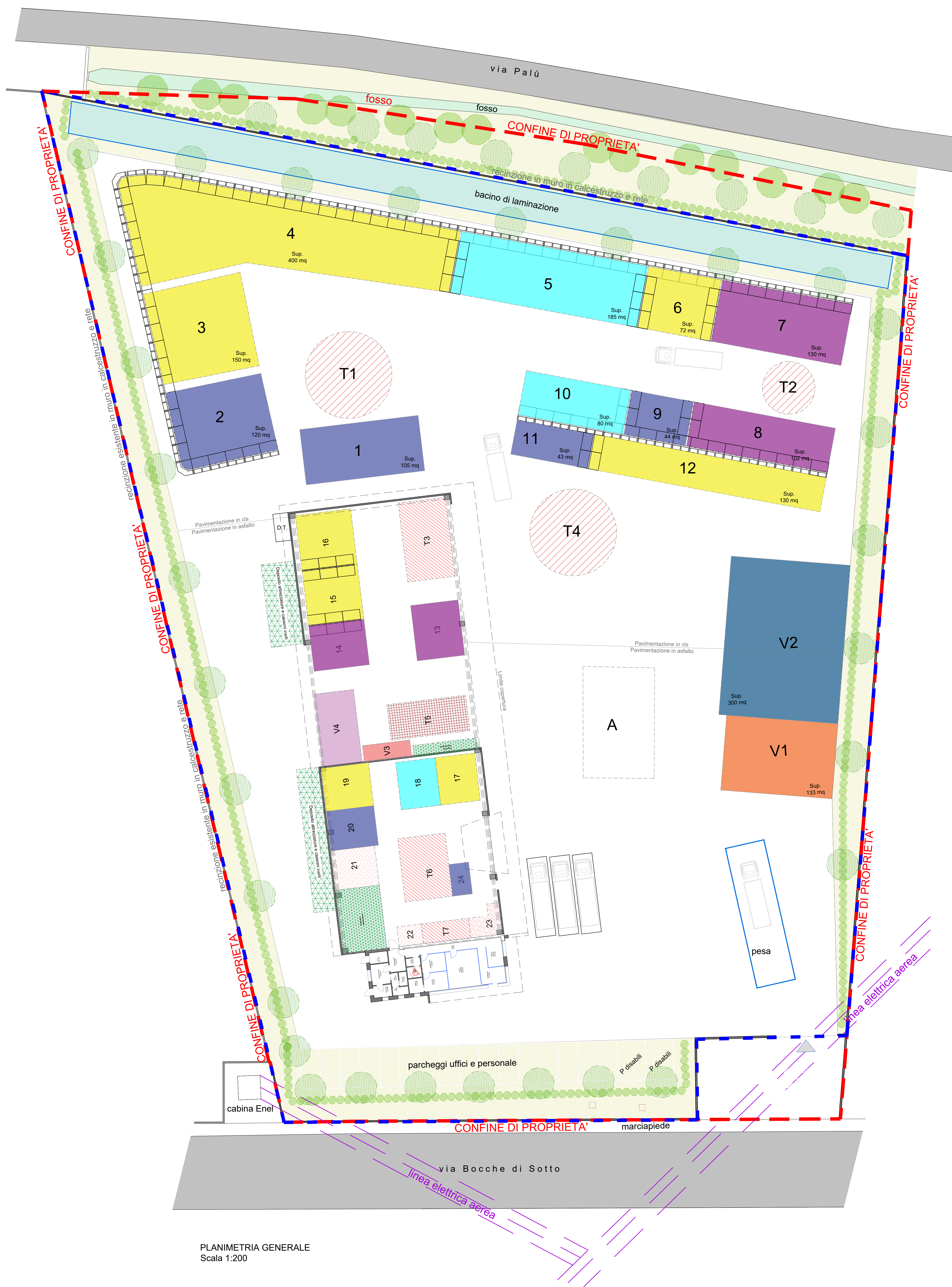
PLANIMETRIA GENERALE Scala 1:200