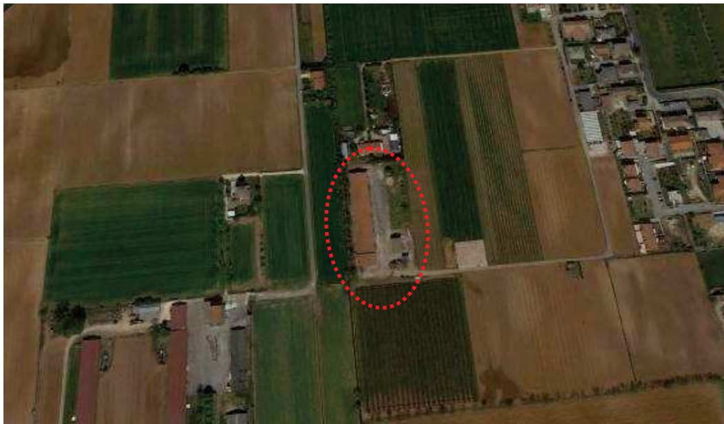
Immagine Google Earth (data acquisizione immagini: 4/11/2020)