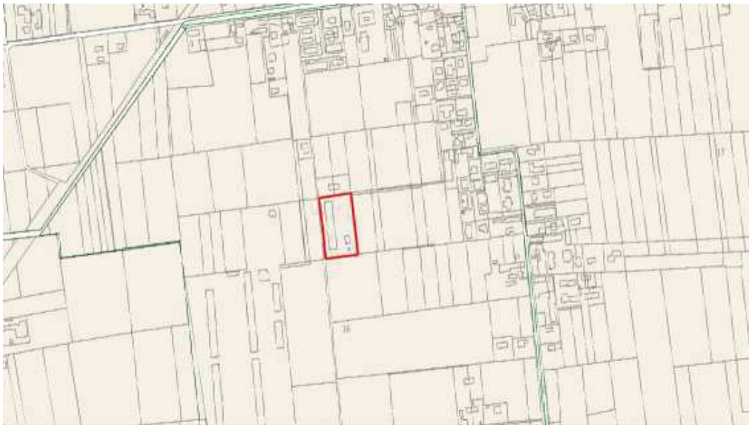
Catastale AE WMS – Vedelago, fg 16, mn 308

Il paesaggio locale, fortemente antropizzato, è caratterizzato dalla presenza diffusa di capannoni per attività artigianali e industriali, inseriti in un contesto agricolo contraddistinto da monoculture ed insediamenti residenziali sparsi.