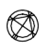
PLANIMETRIA scala 1:250