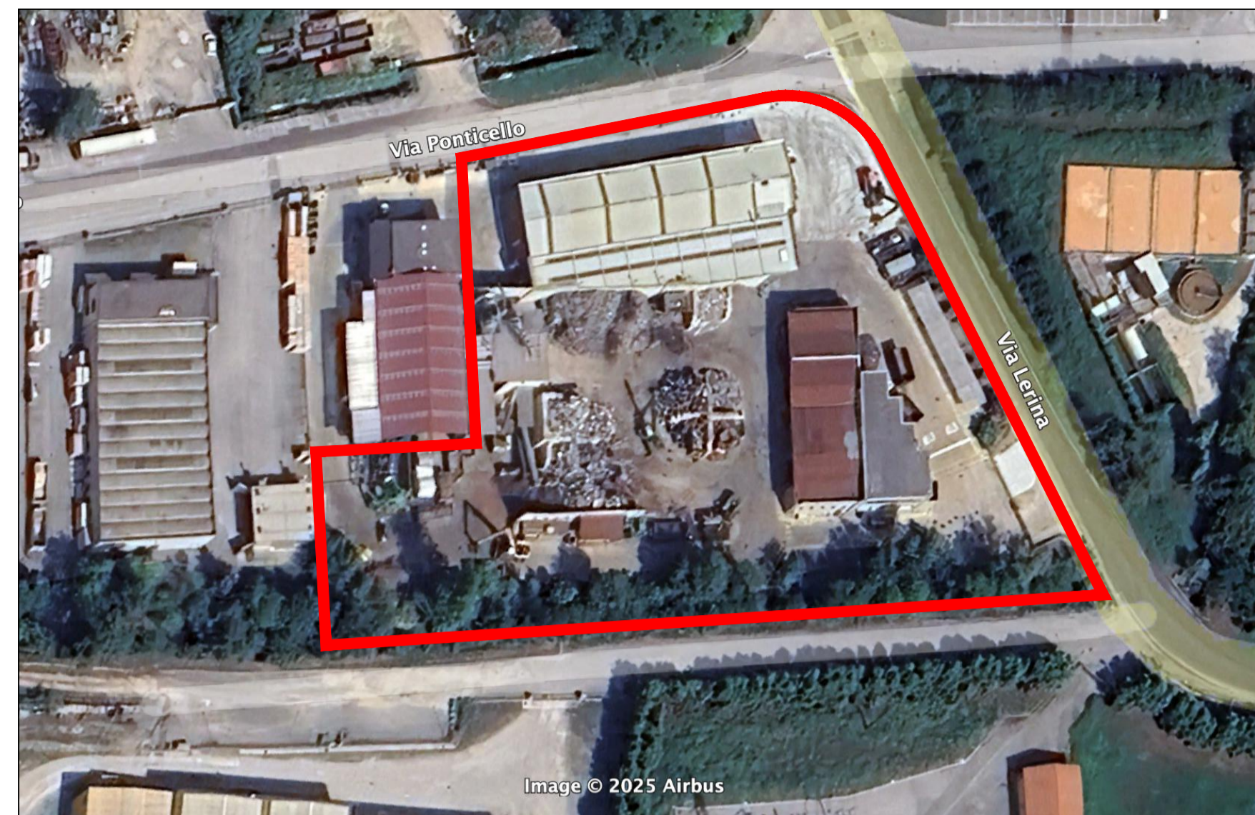
Inquadramento aereo - stato di fatto