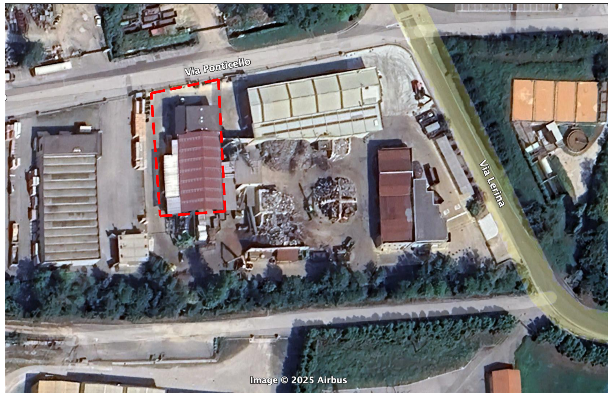
Inquadramento aereo - anessione superficie produttiva